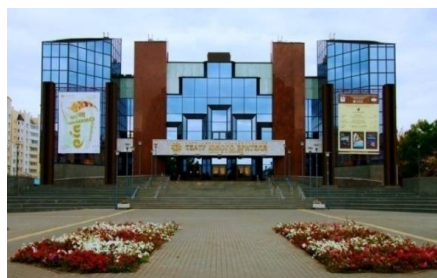
Саратовский театр юного зрителя имени Ю.П. Киселёва https://www.tuz-saratov.ru/