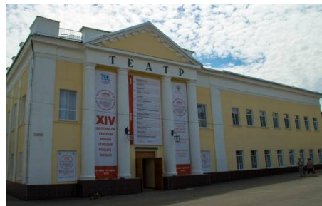
Драматический театр г. Вольска http://volskdrama.ru/