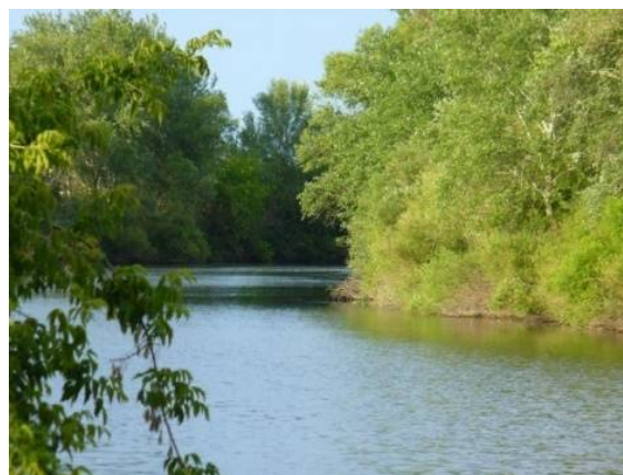
Дьяковский лес (Краснокутский район)

«Лесные фантазии» – детская экологическая тропа со сказочными героями, которые знакомят дошкольников с лесом и его обитателями.