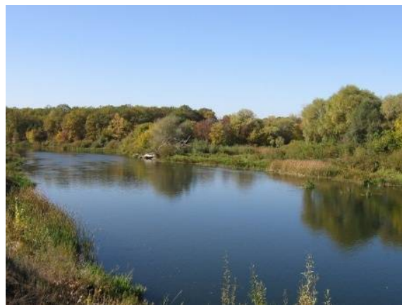
Озеро Рассказань (Балашовский район)

В русле ручья, образованного родником, из-за разной твердости горных пород и резкого перепада высот образовались небольшие пороги и водопады, придающие ручью почти горный характер.