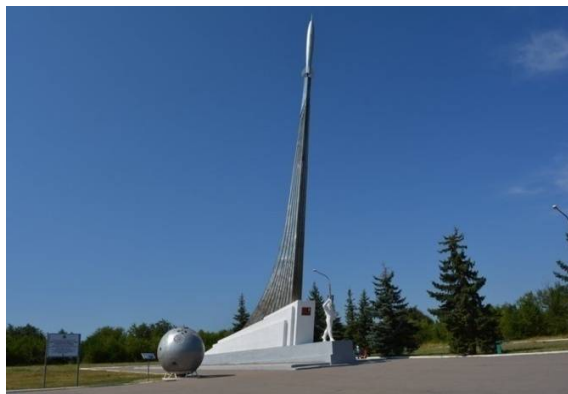
«Начало космического пути» (Энгельский район)

В Саратове, на берегу Волги, впервые поднялся в небо воспитанник саратовского аэроклуба Юрий Гагарин – будущий первый в мире космонавт. На Саратовской земле он приземлился после своего полета в космос. 12 апреля 1961 года вблизи города Энгельса жители села Смеловка услышали взрыв в небе и увидели спускающиеся на землю два парашюта. Новинка 2019 года: в рамках данной экскурсии родители и дети смогут попробовать настоящее космическое питание из тубиков, точно такое же, как у космонавтов во время полетов!