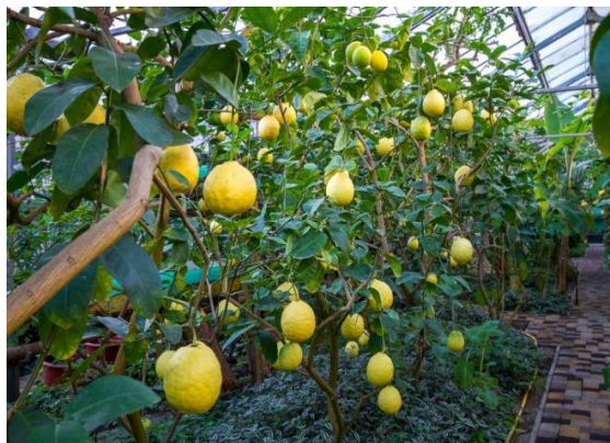
Лимонарий (г. Саратов)

Символами Горпарка стали его постоянные обитатели: белые и черные лебеди, утки, черепахи, белки, множе-