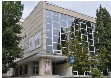
Саратовский театр кукол «Теремок» http://www.teremok-saratov.ru/