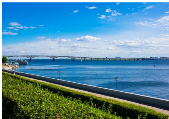
Набережная Космонавтов (г. Саратов)

Фестиваль традиционно проходит на месте, где в XIII–XIV веках находился один из крупнейших городов Золотой Орды, в настоящее время всемирно известный археологический памятник средневековой культуры народов Поволжья.