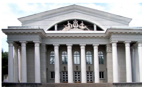
Саратовский академический театр оперы и балета https://www.operabalet.ru/

Предлагаем вашему вниманию официальные сайты некоторых театров Саратова и Саратовской области.