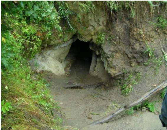
«Тропою Кудеяра» (Новобурасский район)

Кудеярова пещера – ландшафтный и историко-культурный памятник природы. Это место овеяно множеством легенд и поверий. Здесь и истории о разбойнике Кудеяре, и рассказы о зарытых сокровищах.