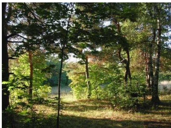
Природный парк «Кумысная поляна» (г. Саратов)

Кумысная поляна – огромный воздушный фильтр, который каждый день пропускает через себя миллионы кубометров воздуха, очищая их от угарного газа, вредных примесей и насыщая кислородом.