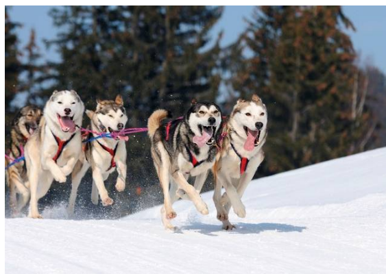
Догтрекинг «В гости к хаски» (Саратовский район)

тительного мира. Здесь можно увидеть, как растет кофе, фейхоа, мирт, маракуйя, пассифлора, бересклет, муррайя и прочие представители тропической флоры. Здесь часто проводятся экскурсии, которые не оставляют равнодушными ни детей, ни взрослых.