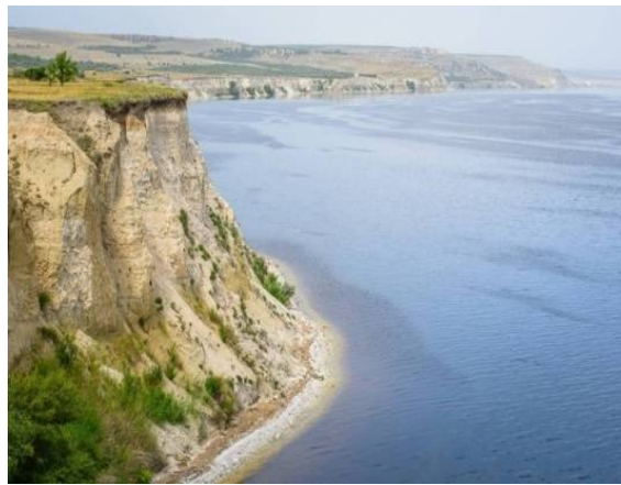
«По следам предков» (Красноармейский район)

Кудеярова пещера – ландшафтный и историко-культурный памятник природы. Это место овеяно множеством легенд и поверий. Здесь и истории о разбойнике Кудеяре, и рассказы о зарытых сокровищах.