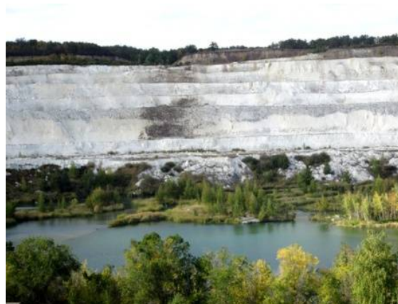
Маршрут «Тайны мелового карьера» (Вольский район)

Кумысная поляна – огромный воздушный фильтр, который каждый день пропускает через себя миллионы кубометров воздуха, очищая их от угарного газа, вредных примесей и насыщая кислородом.