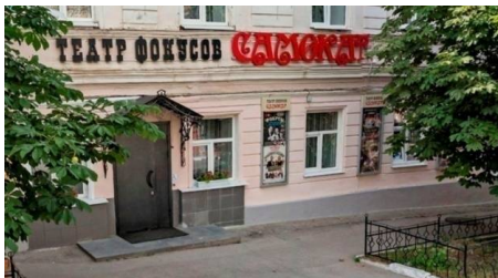
Театр магии и фокусов «Самокат» http://www.teatrsamokat.ru/theatre/