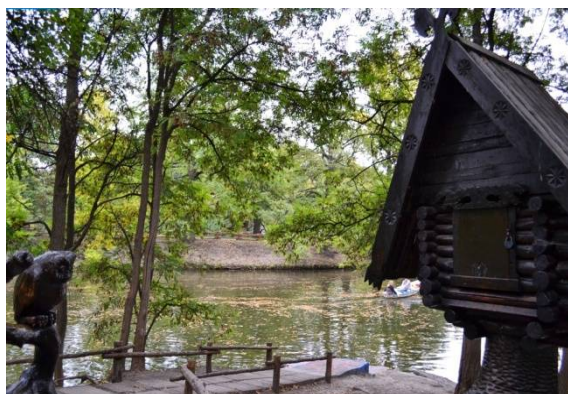
Городской парк (г. Саратов)

На территории парка действует Саратовский государственный музей боевой славы, который представляет своим посетителям огромную коллекцию оружия и военной техники времен Великой Отечественной войны, а также современные образцы вооружений. На экспозиции сельскохозяйственной техники представлено все – от плуга до комбайна, включая полевой стан. С июля 2014 года в музее действует аудиогид. Более двухсот экспонатов получили индивидуальное звуковое сопровождение.