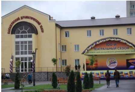
Балашовский драматический театр https://baldt.ru/