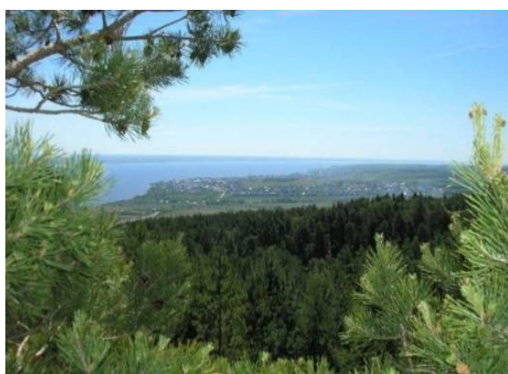
Национальный парк «Хвалынский» (Хвалынский район)

Меловой карьер – уникальное явление, созданное человеком и дополненное природой. В разрезе, сделанном ковшем экскаватора, видны останки живых существ, обитавших на территории Саратовской области миллионы лет назад.