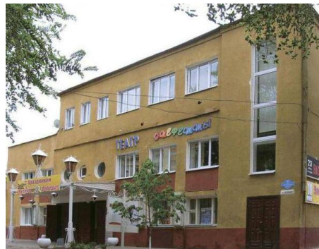
Саратовский областной театр оперетты (г. Энгельс) https://ok.ru/g.oblastnoyteatroperetty