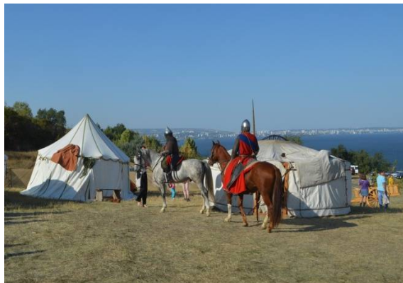
Фестиваль «Укек. Один день из жизни средневекового города»

ство видов рыб и величавые дубы; горбатый мост; парк аттракционов «Лукоморье» и его узнаваемое колесо обозрения «Русские узоры», которое приобрело новый облик и стало настоящим арт-объектом.