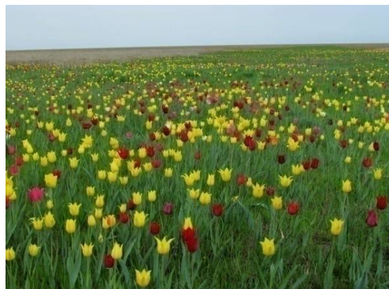
Тюльпанные степи (Новоузенский район)

Для того чтобы увидеть ездовую породу собак хаски, окунуться в мир настоящей дружбы, необязательно следовать на север. Теперь это легко сделать в Саратове. Питомник DogWinter расположен всего в 30 минутах езды от города.