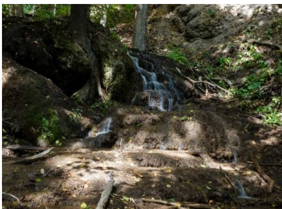
Водопады речки Еланки (Красноармейский район)

Знаменитый утес Степана Разина, о котором рассказывают фантастические легенды, складывают песни и пишут литературные произведения, признан археологическим памятником природы и самым посещаемым туристами местом Саратовской области.