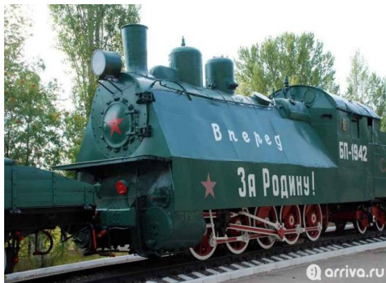
Парк Победы (г. Саратов)

В Саратове, на берегу Волги, впервые поднялся в небо воспитанник саратовского аэроклуба Юрий Гагарин – будущий первый в мире космонавт. На Саратовской земле он приземлился после своего полета в космос. 12 апреля 1961 года вблизи города Энгельса жители села Смеловка услышали взрыв в небе и увидели спускающиеся на землю два парашюта. Новинка 2019 года: в рамках данной экскурсии родители и дети смогут попробовать настоящее космическое питание из тубиков, точно такое же, как у космонавтов во время полетов!