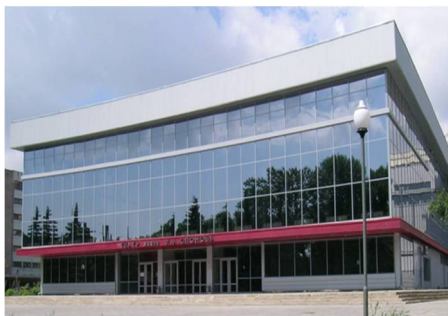
Саратовский государственный академический театр имени И.А. Слонова https://www.saratovdrama.com/